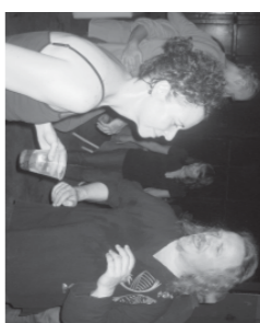
Agradecemos a los vecinos, músicos y agrupaciones completas que le pusieron la mejor energía para que la fiesta fuera una alegría, música y baile...